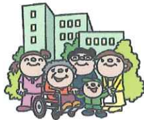
地域の施設や機関