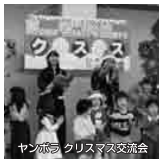
ヤンボラクリスマス交流会