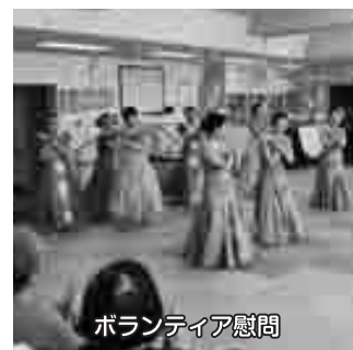
ボランティア慰問