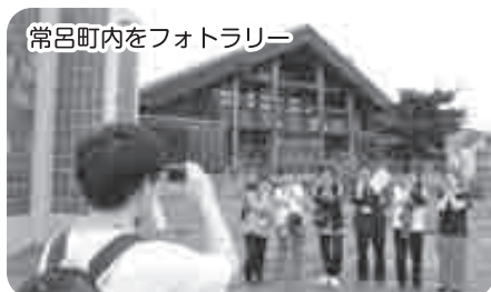
常呂町内をフォトラリー