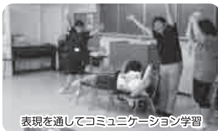
表現を通してコミュニケーション学習