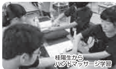
桂陽生から ハンドマッサージ学習