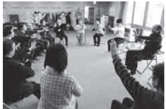
ストレッチ体操の様子