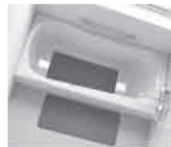
浴槽の中にも外にも設置できます。

ホームセンターやドラッグストアでも購入できます。ちょっとした工夫で安心した入浴ができて美容と健康が高まります。