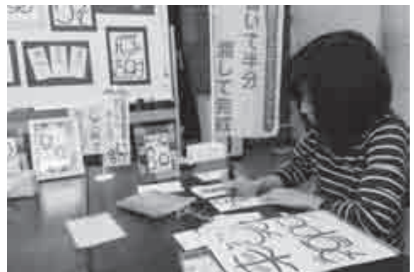
ボランティアによる笑い文字名前書き