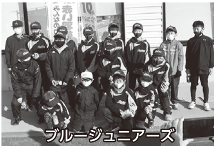
ブルージュニアーズ