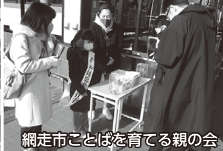
網走市ことばを育てる親の会