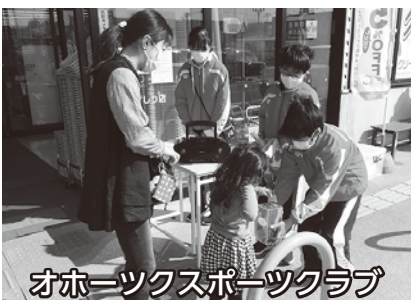
オホソクスポーツクラブ