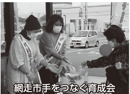
網走市手をつなぐ育成会