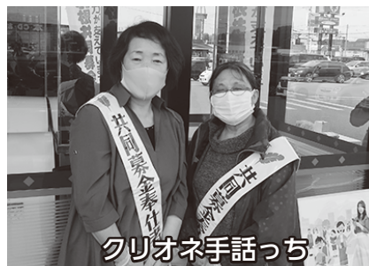
クリオネ手話っち