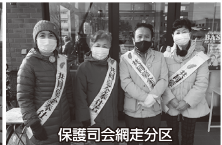
保護司会網走分区