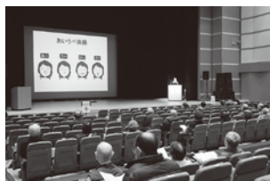
学びを深める研修会