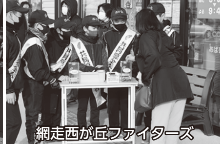
網走西が丘ファイターズ