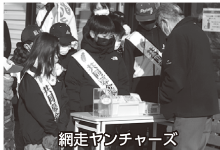
網走ヤンチャーズ