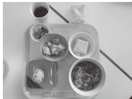
温かな手作り昼食!おいしいですよー

所在地 網走市北11条東1丁目 網走市老人デイサービスセンター 電話 0152-43-0855 (生活相談員まで)