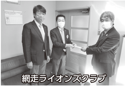
網走ライオンズクラブ