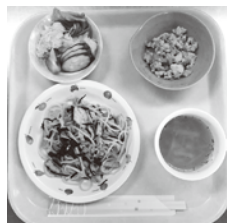
★ひじきスパゲティ ★きのこのスープ ★炒り豆腐 ★ツナサラダ