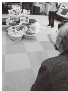
★明日天気になあれ