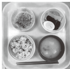
★鮭わかめご飯 ★お味噌汁 ★高野豆腐の煮物 ★大根サラダ