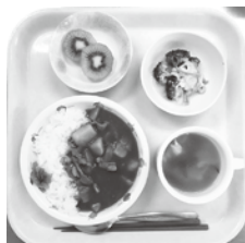
★カレーライス ★たまごスープ ★プロックリーサラダ ★フルーツ