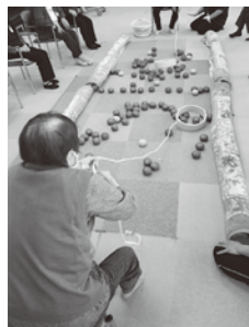
★輪っかで大漁ゲーム