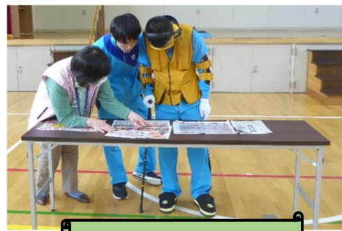
日体大附属高等学校