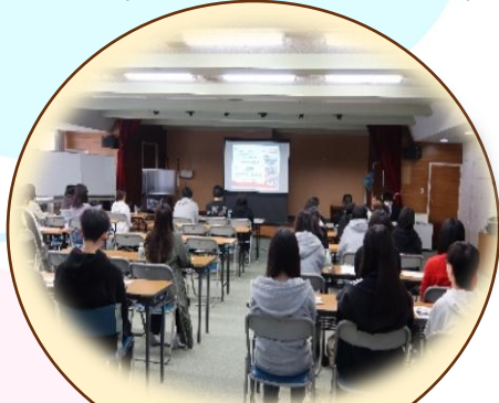
ボランティア企画会議の様子

各学校では本番に向けて準備作業を進めています。次号ではクリスマス交流会当日の様子を掲載します♪