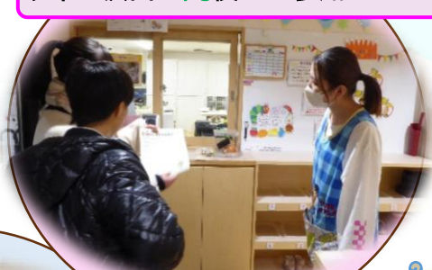
幼稚園・保育園へ案内の様子