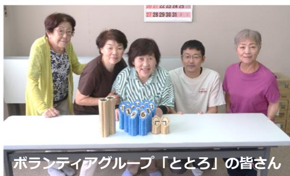
ボランティアグループ「ととろ」の皆さん

ボランティアグループ「ととろ」様（現在は解散）より、「社協事業や地域活動等で役立ててもらいたい」とのことで室内用モルックをご寄贈いただきました！！モルックとは、年齢や性別に関係なく誰もが楽しめるフィンランド発祥のスポーツです。ご寄付いただいた室内用モルックは、本会で実施しております「お話広場 えがお」や「備品貸出」で活用させていただきます。貸出を希望される団体につきましては、網走市社会福祉協議会までお問合せ下さい。